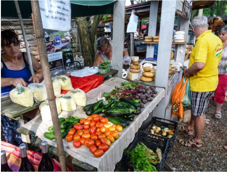
A vegyszermentes zöldségek iránt is nagy volt az érdeklődés

Egyszer Budapesten megkérdeztem egy zöldségest, miként érte el, hogy a portékája fényes, hatalmas és olyan kívánnivaló? Azt mondta, minden egyes darabbal külön foglalkozik. A Liliomkert zöldségei és gyümölcsei nem ilyenek, de semmi baj. Jófajták és enni valóak.