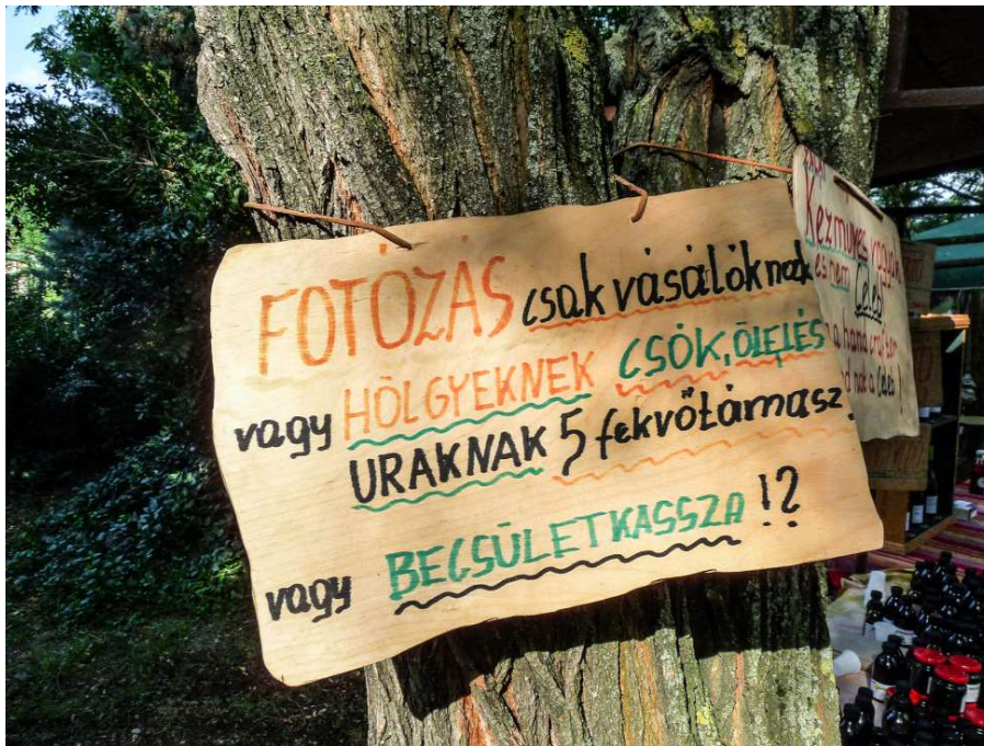
Kommentár nélkül. Nem kellett lenyomnom az öt fekvőtámaszt

A piacon dolgozó árusok mind-mind barátságos emberek. Egyesek szeretik, ha fényképezik őket. Mások meg csak egyszerűen üzennek nekünk.