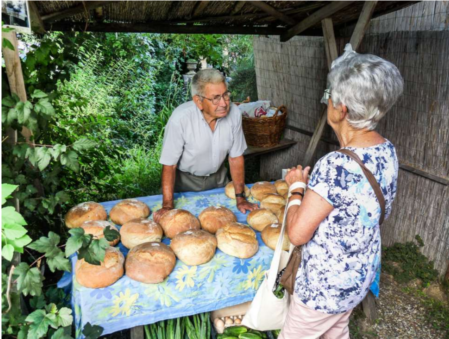
Alkudozás a kemencéből nem olyan régen kivett kenyerek felett

A búcsú pillanata a Liliomkerttől. Valamikor újra visszajövünk. Télen-nyáron nyitva van. Önök azonban egy percre se késlekedjenek. Káptalantóti az év minden vasárnapján nyitva áll azok előtt, akik tényleg a minőségi terméket keresik. Vagy egyszerűen csak egy jó szóra vágnak.