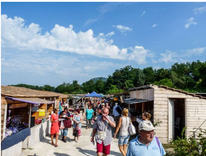
A Liliomkertbe már korán reggel özönlik a tömeg

A Káptalantótiban minden vasárnap reggel kinyitó piacra özönlenek az emberek. A kilenc évvel ezelőtt alapított agora mára teljesen kinőtte a kereteit, nem véletlen, hogy a későn érkezők már egyáltalán nem találnak maguknak parkolóhelyet.