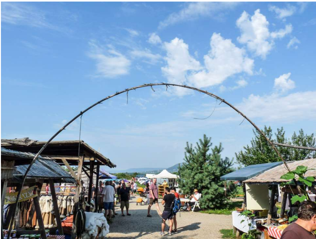
Ragyogó kék ég, gyönyörű táj, az utolsó békebeli agora ebben az országban a Liliomkert Káptalantótiiban, 2 kilométerre Gyulakeszitől, 5-re Tapolcától.

A búcsú pillanata a Liliomkerttől. Valamikor újra visszajövünk. Télen-nyáron nyitva van. Önök azonban egy percre se késlekedjenek. Káptalantóti az év minden vasárnapján nyitva áll azok előtt, akik tényleg a minőségi terméket keresik. Vagy egyszerűen csak egy jó szóra vágnak.