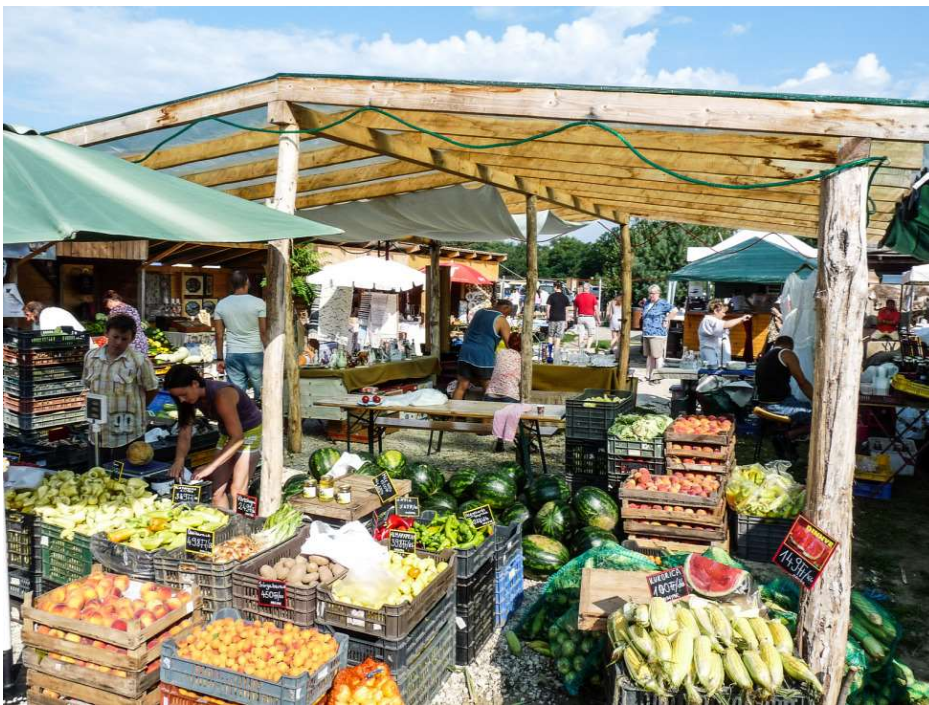
Ami itt nem kapható az nincs is ebben az országban

Egyszer Budapesten megkérdeztem egy zöldségest, miként érte el, hogy a portékája fényes, hatalmas és olyan kívánnivaló? Azt mondta, minden egyes darabbal külön foglalkozik. A Liliomkert zöldségei és gyümölcsei nem ilyenek, de semmi baj. Jófajták és enni valóak.